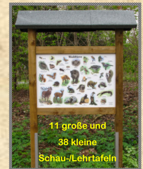
11 große und 38 kleine Schau-/Lehrtafeln