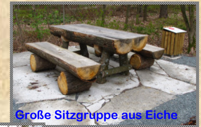
Große Sitzgruppe aus Eiche